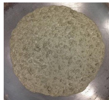
ダックスコンクリート

高強度コンクリート特有の高い粘性(材料分離抵抗性)に加え、適切な流動性を付与することで、部材製作時に必要となる、バランスの取れたワーカビリティを実現しています。